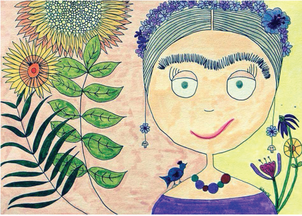
Çizim: Özlem Çelik

Normcore modasından bahsediliyordu bir blogda. “Stil yaratma derdine girmeden giyinmek” tanımı ardından ‘normcore’ün olmazsa olmaz parçaları’ndan bahsediliyor: yırtık kotlar, bol trikolar, vs... Kime oy verdiğinden bağımsız olarak iktidarda olana sorgusuz bağlılık yeminleri edilir ya, moda da öyle bir şey oldu sanki. Bir Woody Allen filmi “Roma’dan Sevgilerle”de, basit bir yaşam süren bir