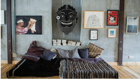
Görsel: Bina'nın iç tasarımından bir görüntü 5

laşan algılarımla müziği yeniden keşfetmek artık eskisi kadar tat vermiyor. Şimdi bazen sohbet edebilmeyi özlüyorum; şimdi eskisinden daha sık şarap içerken buluyorum kendimi. Yani, “yaşlılar için tasarlanmış sakince bir mekan”dan beklentim, bizim gibi otuzlu yaşlarında, Kadıköy’de büyümüş, hafta içi bir akşam arkadaşlarıyla birer kadeh eşliğinde sohbet eden insanları bulmaktı.