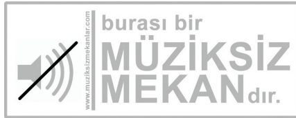
Görsel: Müziksiz mekan uyarısı 1

“Müziksiz Mekanlar”, işte bu düşüncelerin bir sonucu olarak ortaya çıkan bir tepki. “Toplumların ortak müzik zevki yoktur, yalnızca bireylerin müzik zevkinden bahsedebiliriz,” diyor bu oluşum. Hatta bireyin bile gün içerisindeki farklı ruh hallerine göre anlık müzik zevkinin değişebileceğinin altını çiziyor. Bu oluşum, mekan algısını oluşturan en önemli verilerden biri olan akustiği ön planda tutuyor; ortamın işlevi dolayısıyla ortaya çıkan seslerin mekanın karakteristik ses peyzajını oluşturduğunu ve bu “organik” seslerin mekanlara kişilik kattığını savunuyor.