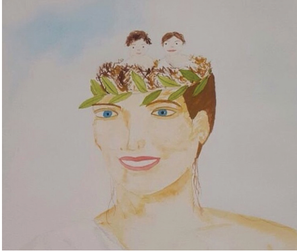
Çizim: Nevin Öztürk - Instagram: @paperboatart

Birkaç yıl önce gazetelerde ünlü bir iş adamının, beş yaşındaki kızına bakan Özbek bakıcıyı darp ettiğiyle ilgili haberler çıkmıştı. Bakıcının kendi ifadesine göre işverenleri gelmeleri gereken saatten daha geç geleceklerini haber vermiş, o da bir arkadaşıyla buluşup ona borcunu ödemek zorunda olduğu için çocuğu alıp Fikirtepe'ye götürmüş. Bu sırada aileye haber vermemiş, aile de çocuklarının kaçırıldığını düşünüp paniğe kapılmış. Bakıcı çocukla beraber eve döndüğünde de baba bakıcıyı (demir çubukla) darp etmiş. Haberde kadıncağızın sargılar içinde bir de fotoğrafı vardı.