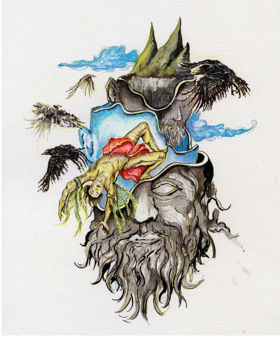
Çizim: Elif Mercan

İkarus'un öyküsü malumunuz bir dramdır: Girit'ten kaçmaya çalışan İkarus, babası Daedalus ile beraber kumsalda pineklemektedir. Girit'in iri ökülzleri kadar meşhur labirentini inşa eden Daedalus kumsalda martı tüyleri (ve tahminen ölüleri) görmüştür. Elinde biraz da balmumu vardır. Daedalus bir antik dünya dahisi olup mühendislik fakültesine gitmediği için parlak fikirlerini kendine saklamaz. Balmumuna şekil verip martı tüylerini balmumuna dizerek takılabilir kanat yapar. Yaptığı kanatların kullanımını oğlu İkarus'a anlatır: Kanatları takan ne çok alçaktan ne de çok yüksekte uçmalıdır. Çok alçaktan uçarsa denizin nemi kanatları ıslatacak ve artık uçamayacaktır. Eğer çok yüksekte uçarsa güneş ışığı kanatları çok fazla ısıtacak ve balmumu eriyecektir.