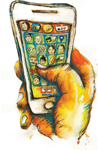
Çizim: Elif Mercan

Bu son cümleyle rengimi çok belli ettim, hemen ekledim: